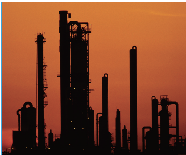
化学工業では分離プロセスに広範囲の有機溶剤を使用します。

また、配合技術者は貯蔵期限を制限したり不安定化するような相分離挙動にも注意を払います。